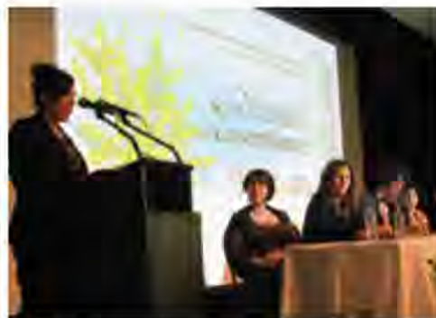
Nella foto : Interventi alla conferenza.

This year's annual International Women's Day conference, organized by the Quebec Chapter of the National Congress of Italian-Canadians, was held March 3 and 4 at Casa d'Italia. The theme of the two day conference was "Diversity and Similarities". The purpose of the event was to promote the significant contributions women have made in all aspects of our modern society. The event also included an art exhibit displaying the works of women from different nations including Vietnam, Serbia, Croatia, Greece, Italy and France.